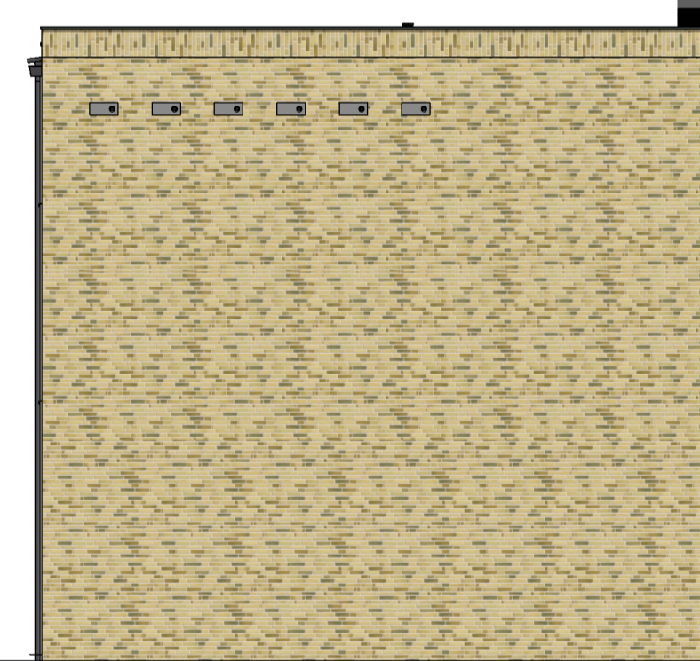
B9s bouwnr. 52