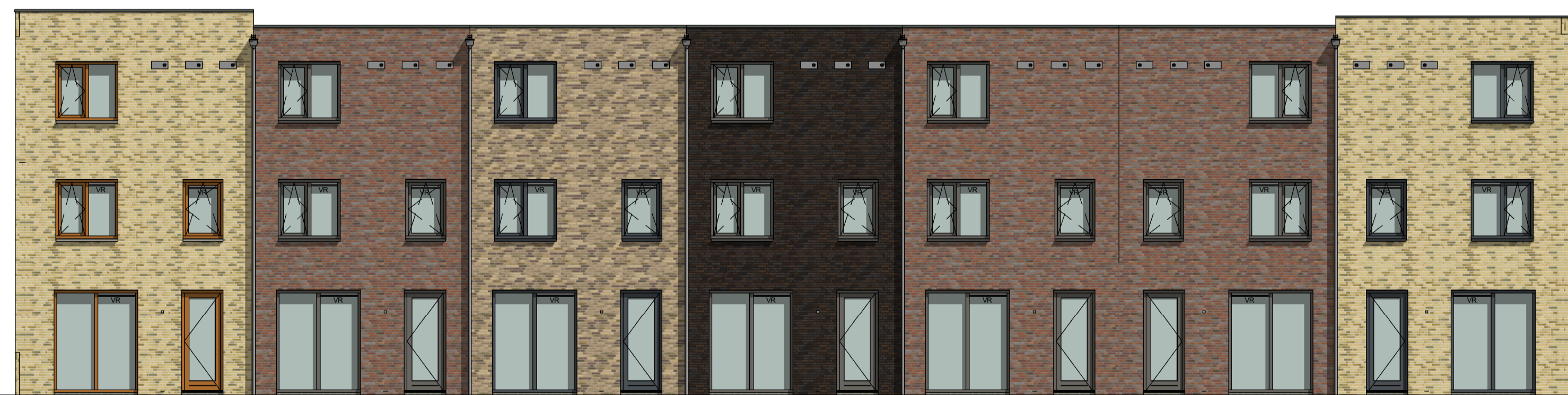
B10 bouwnr. 58 K5 bouwnr. 57 K3 bouwnr. 56 K2 bouwnr. 55 K1 bouwnr. 54 K1s bouwnr. 53 B9s bouwnr. 52

De aangegeven materialen en maatvoering zijn indicatief. In werkelijkheid kunnen (geringe) afwijkingen vanwege, bouwwijze, stabiliteit en/of voorschriften van overheidswege cg. nutsbedrijven mogelijk zijn, zonder dat hier rechten aan ontleend kunnen worden.